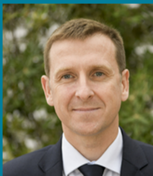
LE MOT DE PHILIPPE COURT, PRÉFET DU VAL-D'OISE

Pour accélérer vos projets de transition écologique